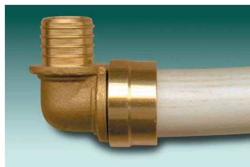
Figure 1 - Raccord à glissement

La gamme proposée comporte pour chaque dimension :