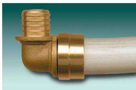
Figure 2 - Réalisation des assemblages

Procéder à l'assemblage en actionnant la pince jusqu'à butée