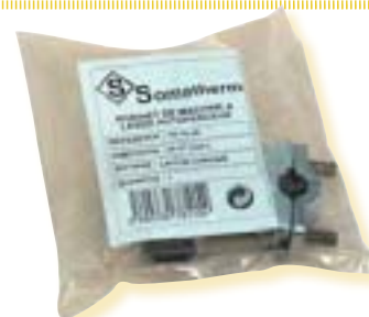
Identification du produit et Gencod